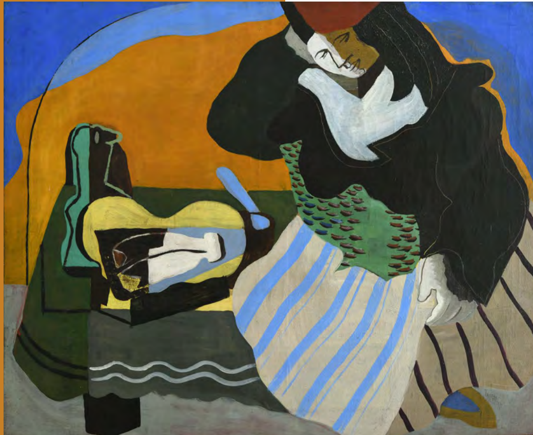
6. Jean Lurçat Femme Turque, 1925, huile sur toile, Paris, Maison-Atelier Lurçat, en dépôt à Perpignan, musée d'art Hyacinthe Rigaud.

Au cours des années 1920 et 1930, Jean Lurçat forge sa réputation de peintre à travers la toile, son premier terrain d'expression. Ses œuvres, enrichies par les influences parisiennes de l'époque, dialoguent avec les grandes figures du modernisme telles que Henri Matisse, Pablo Picasso, Fernand Léger, et même Le Corbusier. Jean Lurçat s'illustre par une approche qui marie le cubisme, avec sa déconstruction du réel en facettes géométriques, aux couleurs vibrantes des Nabis, et aux décors surréalistes. Ainsi, sa peinture, tout en étant profondément moderne, témoigne de ses voyages , de ses expériences de guerre et de ses préoccupations pour l'avenir de l'humanité , oscillant entre une inquiétude latente et une espérance ardente.