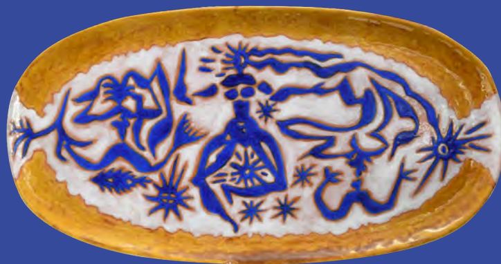
10. Jean Lurçat Sirènes, vers 1959, édition 1960-1981, Perpignan, musée d'art Hyacinthe Rigaud.