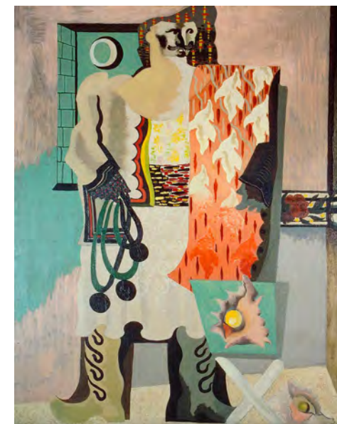
2. Jean Lurçat, Le Bourreau, 1926, huile sur toile, Angers, musée d'Angers.

renouveau du cadre de vie, influencé par le mouvement Art déco . Ce courant se caractérise par des formes simplifiées et des motifs stylisés. À cette période, deux tendances se distinguent : d'une part, les « contemporains », qui perpétuent l'excellence de la tradition française, et d'autre part, les « modernes », une jeune génération inspirée par l'industrie et les nouvelles technologies, aspirant à un progrès technique et social.