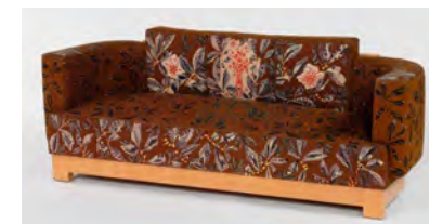
9. Jean Lurçat, André Lurçat (architecte), A. Décaux (ébéniste), Causeuse, Les illusions d'Icare , 1937 (carton), 1938 (tissage), manufacture de Beauvais, Paris, Mobilier National.

L'œuvre Liberté , dont le carton est réalisé en 1942 puis tissée clandestinement dès 1943, est un exemple emblématique de l'engagement de Lurçat. Le soleil flamboyant, élément central de la composition, rayonne comme un symbole d'espoir et de vie, tandis que la planète calcinée, parsemée de crânes, illustre la destruction et la guerre. Le coq perché au-dessus du soleil, avec ses connotations de patriotisme, de triomphe et de renaissance, renvoie à la victoire et à la résistance face à l'ennemi. Les citations du poème d'Éluard, intégrées dans la composition, renforcent le message de Lurçat et attestent du pouvoir engagé de la tapisserie, qui dépasse ici sa fonction décorative pour devenir un puissant vecteur de symbolisme et d'espoir.