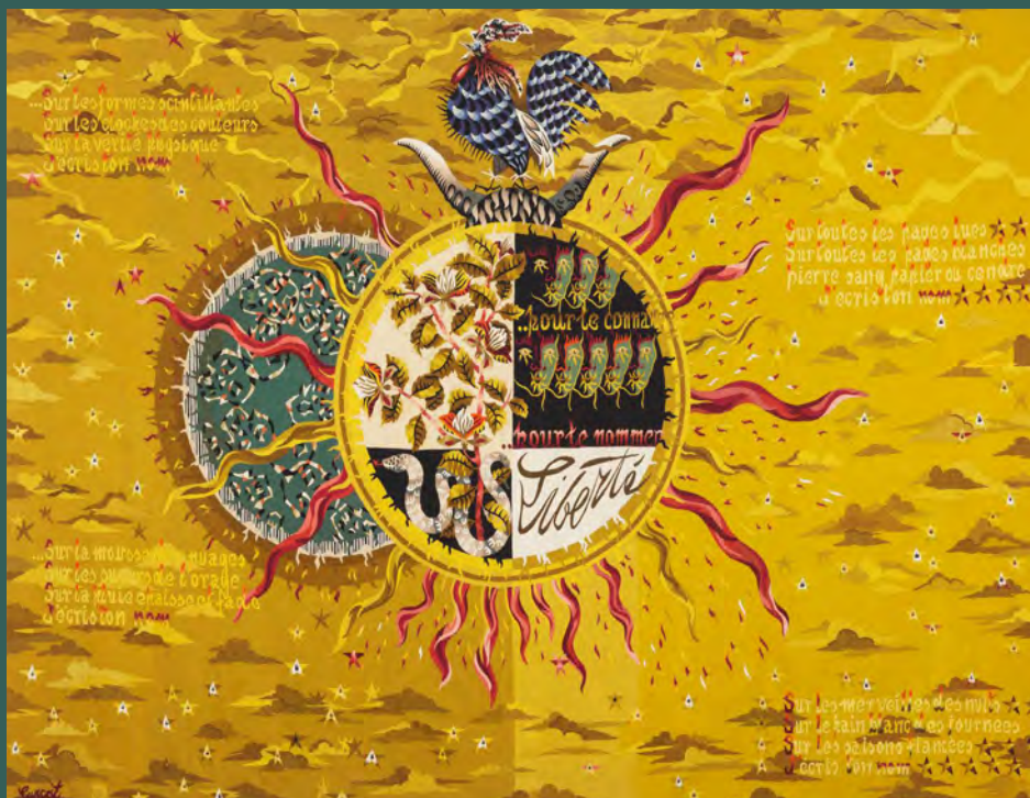
7. Jean Lurçat, Liberté, 1942 (carton), 1952 (tapisserie), tapisserie de basse lisse en laine et coton, atelier Picaut à Aubusson, Angers, musée d'Angers.