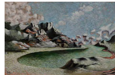
4. Jean Lurçat , Lac de montagne , 1936, huile sur toile, Paris, musée d'Art moderne. ©ADAGP2024

une approche de rareté et de précision, cherchant à reproduire la peinture avec fidélité, Jean Lurçat aspirait à un projet plus ambitieux . Il souhaitait créer un mouvement artistique plus large, impliquant de nombreux créateurs. Cette ambition l'a conduit à travailler avec des artisans et artistes dans les ateliers de tissage à Aubusson . Plus tard, c'est au sein de l'atelier de céramique Sant Vicens à Perpignan que Jean Lurçat développe sa volonté de création d'objet d'art accessible au grand public. En effet, contrairement à la peinture de chevalet, qui produit des œuvres uniques et souvent destinées à un cercle restreint, Jean Lurçat voit en la céramique un moyen d'offrir des créations en séries limitées rendant ses œuvres accessibles à un public plus vaste et éloignant ainsi l'idée que l'art doit être réservé à une élite privilégiée.