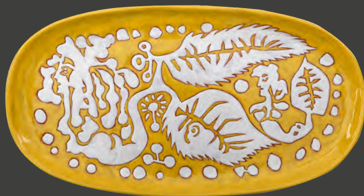
15. Jean Lurçat Atelier Raymond Picaud, Aubusson Plat, Sirènes-feuilles Terre cuite rouge émaillée Legs Firmin Bauby, 1981 Département des Pyrénées-Orientales