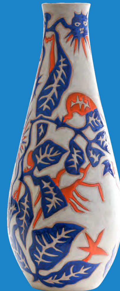
14. Jean Lurçat Atelier Raymond Picaud, Aubusson Vase de forme, Danseuses, astres et feuillage Vers 1960 Terre cuite rouge émaillée Département des Pyrénées-Orientales ; en dépôt à Céret, Musée d'art moderne