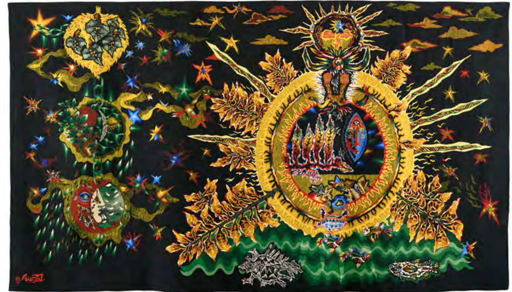
5. Jean Lurçat, Apollo, les quatre éléments, 1961, tapisserie de basse lisse, atelier Picard à Aubusson, Paris, Maison-atelier Lurçat, en dépôt à Perpignan, musée d'art Hyacinthe Rigaud.

Dans les œuvres de Jean Lurçat et au fil de toute l'exposition, les quatre éléments — la terre, le feu, l'eau et l'air — s'imposent comme des motifs récurrents et essentiels. Ces éléments, piliers de l'univers, sont évoqués par Jean Lurçat à travers une galerie de formes vivantes et symboliques : animaux, végétaux (comme le taureau, les poissons, les lianes, les feuilles, les insectes) et êtres mythiques tels que la sirène, qui incarne à la fois la terre et l'eau. L'astronomie , quant à elle, se déploie avec éclat dans ses représentations du soleil, de la lune et des étoiles, et de leur union indéfectible.