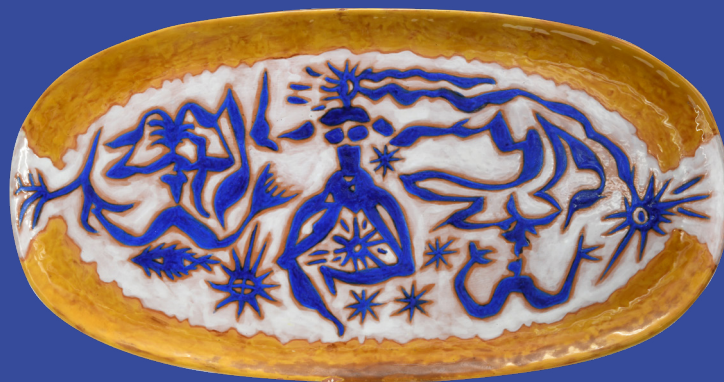
10. Jean Lurçat Sirènes, vers 1959, édition 1960-1981, Perpignan, musée d'art Hyacinthe Rigaud.