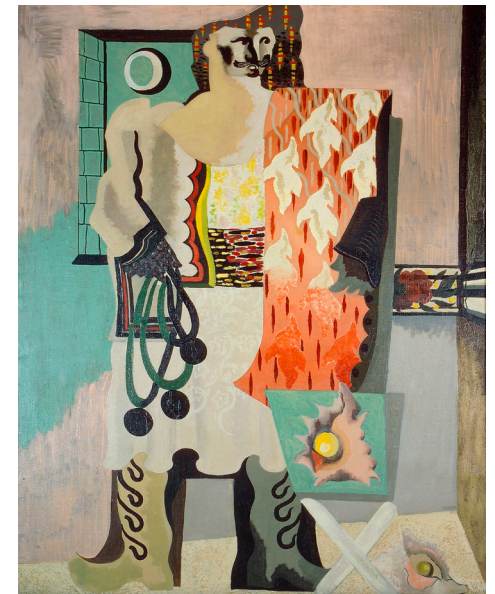
2. Jean Lurçat, Le Bourreau, 1926, huile sur toile, Angers, musée d'Angers.

renouveau du cadre de vie, influencé par le mouvement Art déco . Ce courant se caractérise par des formes simplifiées et des motifs stylisés. À cette période, deux tendances se distinguent : d'une part, les « contemporains », qui perpétuent l'excellence de la tradition française, et d'autre part, les « modernes », une jeune génération inspirée par l'industrie et les nouvelles technologies, aspirant à un progrès technique et social.