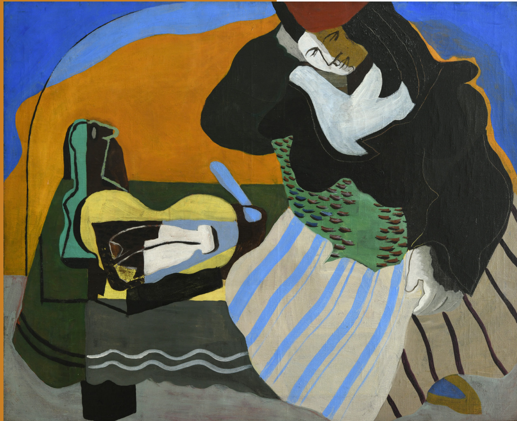
6. Jean Lurçat Femme Turque, 1925, huile sur toile, Paris, Maison-Atelier Lurçat, en dépôt à Perpignan, musée d'art Hyacinthe Rigaud.

A u cours des années 1920 et 1930, Jean Lurçat forge sa réputation de peintre à travers la toile, son premier terrain d'expression. Ses œuvres, enrichies par les influences parisiennes de l'époque, dialoguent avec les grandes figures du modernisme telles que Henri Matisse, Pablo Picasso, Fernand Léger, et même Le Corbusier. Jean Lurçat s'illustre par une approche qui marie le cubisme, avec sa déconstruction du réel en facettes géométriques, aux couleurs vibrantes des Nabis, et aux décors surréalistes. Ainsi, sa peinture, tout en étant profondément moderne, témoigne de ses voyages , de ses expériences de guerre et de ses préoccupations pour l'avenir de l'humanité , oscillant entre une inquiétude latente et une espérance ardente.