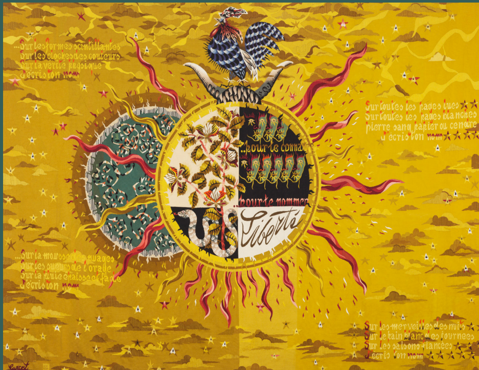
7. Jean Lurçat, Liberté, 1942 (carton), 1952 (tapisserie), tapisserie de basse lisse en laine et coton, atelier Picaut à Aubusson, Angers, musée d'Angers.