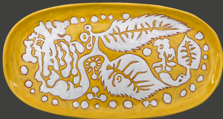
15. Jean Lurçat Atelier Raymond Picaud, Aubusson Plat, Sirènes-feuilles Terre cuite rouge émaillée Legs Firmin Bauby, 1981 Département des Pyrénées-Orientales