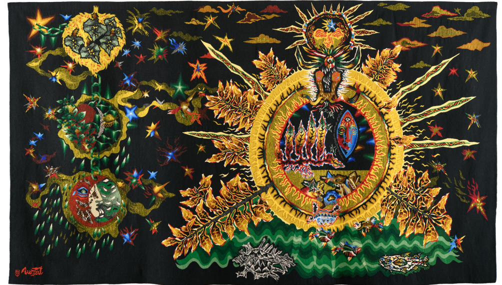
5. Jean Lurçat, Apollo, les quatre éléments , 1961, tapisserie de basse lisse, atelier Picard à Aubusson, Paris, Maison-atelier Lurçat, en dépôt à Perpignan, musée d'art Hyacinthe Rigaud.

Dans les œuvres de Jean Lurçat et au fil de toute l'exposition, les quatre éléments — la terre, le feu, l'eau et l'air — s'imposent comme des motifs récurrents et essentiels. Ces éléments, piliers de l'univers, sont évoqués par Jean Lurçat à travers une galerie de formes vivantes et symboliques : animaux, végétaux (comme le taureau, les poissons, les lianes, les feuilles, les insectes) et êtres mythiques tels que la sirène, qui incarne à la fois la terre et l'eau. L'astronomie , quant à elle, se déploie avec éclat dans ses représentations du soleil, de la lune et des étoiles, et de leur union indéfectible.