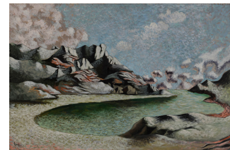
4. Jean Lurçat , Lac de montagne , 1936, huile sur toile, Paris, musée d'Art moderne. ©ADAGP2024

une approche de rareté et de précision, cherchant à reproduire la peinture avec fidélité, Jean Lurçat aspirait à un projet plus ambitieux . Il souhaitait créer un mouvement artistique plus large, impliquant de nombreux créateurs. Cette ambition l'a conduit à travailler avec des artisans et artistes dans les ateliers de tissage à Aubusson . Plus tard, c'est au sein de l'atelier de céramique Sant Vicens à Perpignan que Jean Lurçat développe sa volonté de création d'objet d'art accessible au grand public. En effet, contrairement à la peinture de chevalet, qui produit des œuvres uniques et souvent destinées à un cercle restreint, Jean Lurçat voit en la céramique un moyen d'offrir des créations en séries limitées rendant ses œuvres accessibles à un public plus vaste et éloignant ainsi l'idée que l'art doit être réservé à une élite privilégiée.