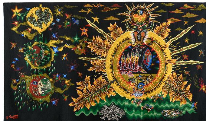
16. Jean Lurçat Atelier Raymond Picaud, Aubusson Apollo, les quatre éléments 1961 Tapisserie de basse lisse en laine H. 237 x L. 427 cm; signée en bas, à gauche « Lurçat »; marque d'atelier en bas, à gauche Paris, Maison-atelier Lurçat, inv. DFL.T.11; en dépôt à Perpignan, musée d'art Hyacinthe Rigaud