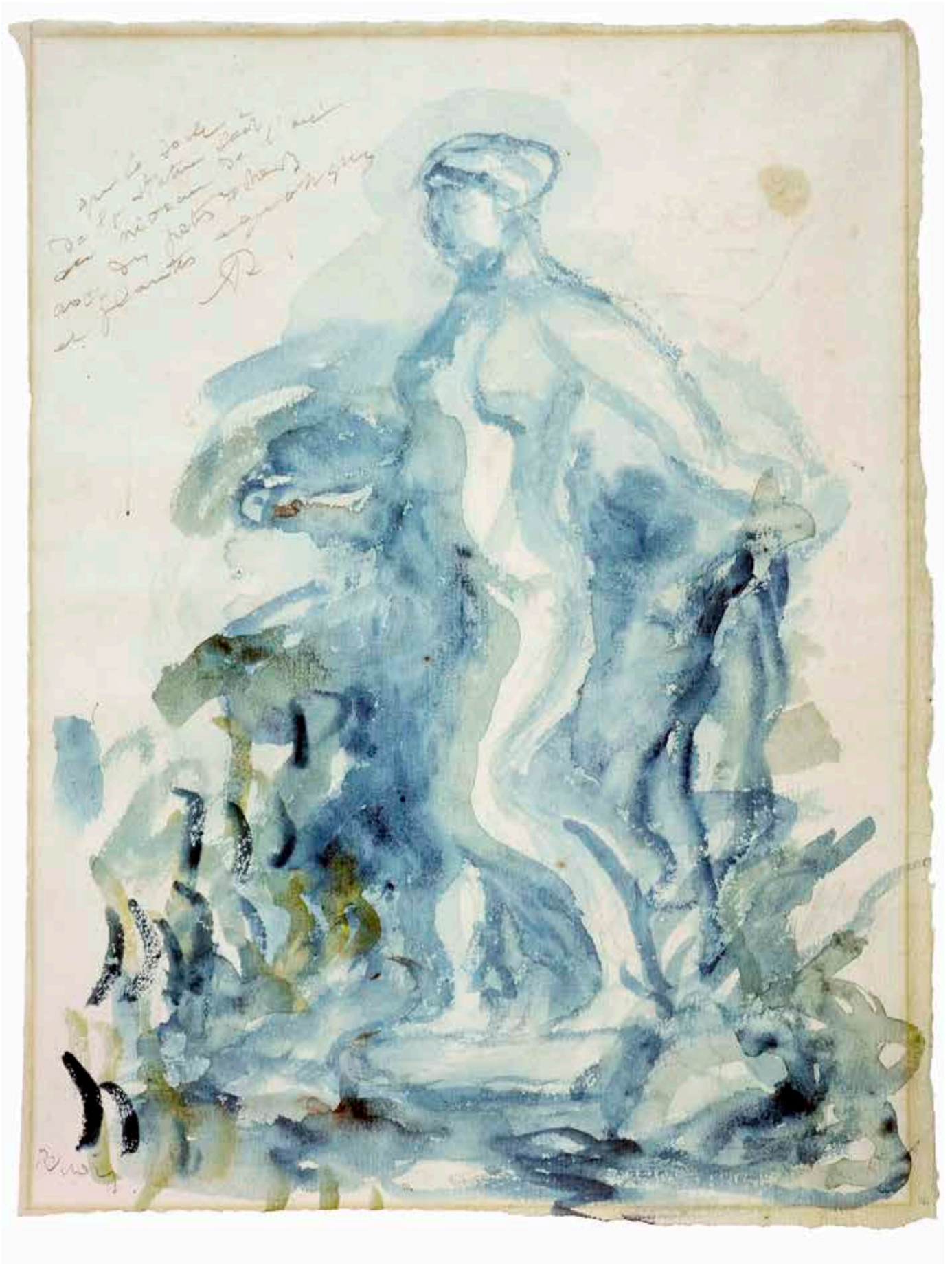
Pierre Auguste Renoir (1841-1919). Étude pour la Vénus Victrix, 1914.